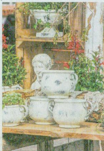
Ob Deko-Artikel, Pflanzen oder Möbel - die Messe „LebensArt“ bietet Gartenfreunden neueste Trends und Beratung.